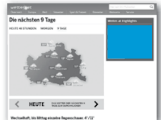
Wetter 9 Tage